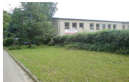
Hala praxe a odborného výcviku Nový Dvůr