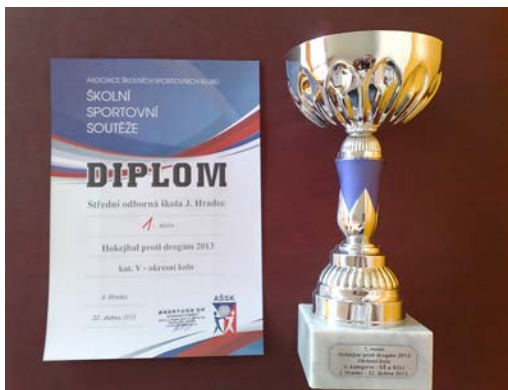
SOŠ Jáchymova JH - 1. místo