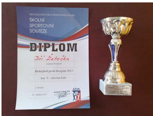
Jiří Žatečka - nejlepší gólman