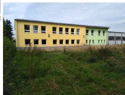
Hala praxe a odborného výcviku Nový Dvůr