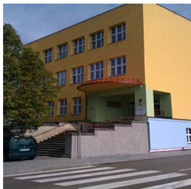
Budova školy Miřiovského