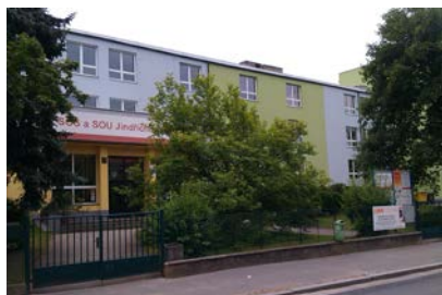
Budova školy Jáchymova 478