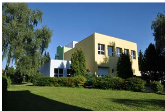
a areál školy