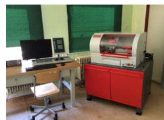
Hala odborného výcviku