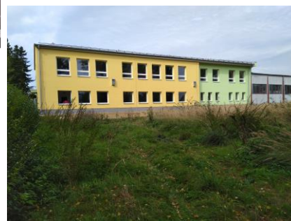
Hala praxe a odborného výcviku Nový Dvůr