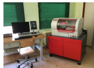
Hala odborného výcviku