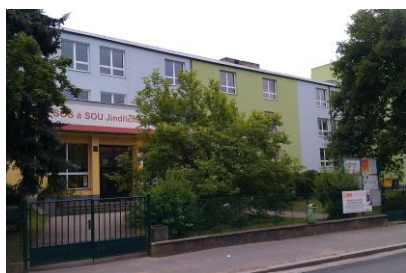
Budova školy Jáchymova 478