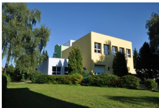
a areál školy