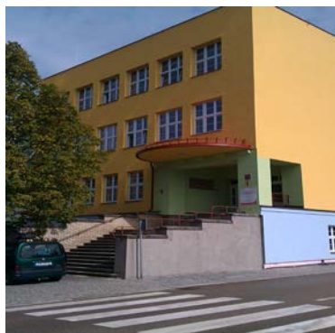
Budova školy Miřiovského