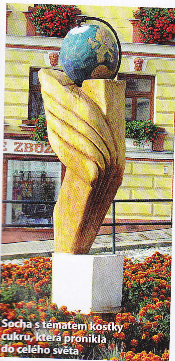
Socha s tématem kostky cukru, která pronikla do celého světa