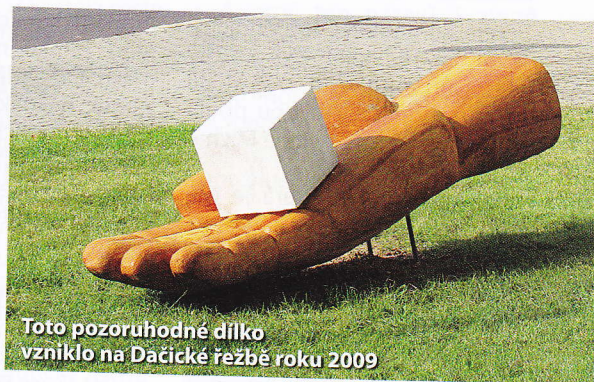
Toto pozoruhodné dílko vzniklo na Dačické řezbě roku 2009

Přijedeme-li do Dačic vlakem, vystoupíme na zastávce Dačice-město. Jestli jsme opravdu zvědavými turisty, můžeme jít na křižovatce u hotelu Dyje doleva do Jemnické ulice a pak opět vlevo po krytém schodišti ke klášteru.