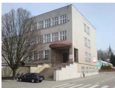
Budova školy Miršovského