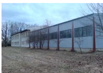
Hala praxe a odborného výcviku Nový Dvůr